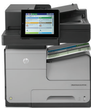
HP Officejet Enterprise Color X585dn Multifunktionsdrucker

Die Druckrevolution für Ihr Unternehmen. Im Vergleich zu Laserdruckern liefern HP Officejet MFPs Farbdrucke doppelt so schnell, aber zu der Hälfte der Kosten pro Seite – und sie bieten Kopier-, Scan- und Faxfunktionen. 1,2,3 Sie sind für erweiterte Arbeitsabläufe konzipiert und besonders langlebig.