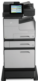
HP Officejet Enterprise Color Flow X585z MFP mit optionalem Papierfach und Druckerlade/Unterstand